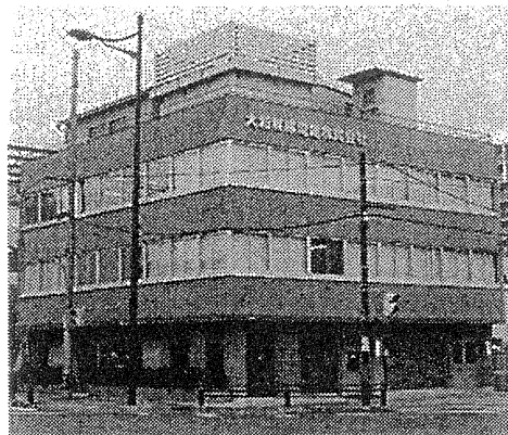
大和無線電器の本社ビル

はスピードを増して変化しているが、常に変化を感じ取り、取引先とともに成長していく」と話し